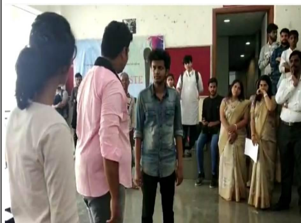
A comic but powerful skit on gender equality in motion at college campus on 17 Feb 2020