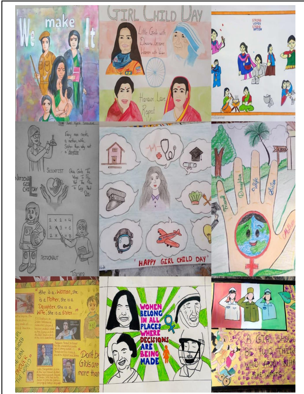
Marathwada Mitra Mandal's College of Commerce, Pune conducted an online poster competition titled "Gender Equity" on, 10 Feb 2020