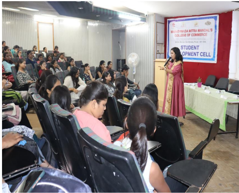
Anti-Dowry Elocution Competition organized on 13 th December 2018 under student development cell